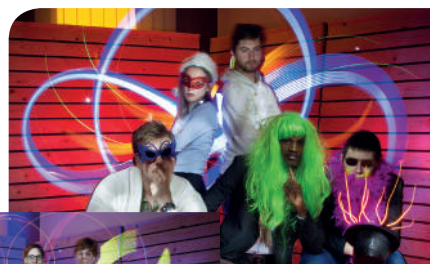
Des résidents du FJT Jules Verne