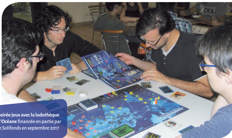
Soirée jeux avec la ludothèque d'Océane financée en partie par le Solifonds en septembre 2017