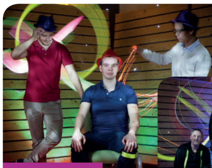
Des résidents du FJT Grand Voile